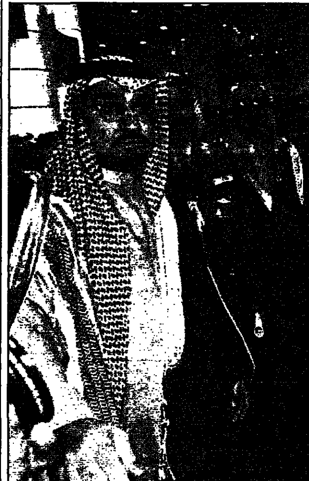
الامير عبد الله يقابل قادة الاجتماعات في طهران بعد جلسة الافتتاح امين (رويترز)

لقاء قمة بين عرفات والرئيس الاسد في ايران.. وزعماء يطالبون برفع الحصار عن العراق